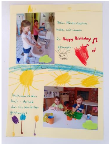
Hygienekonzept mit Kindern

Auch unser Team sammelt in der Corona-Krise viele positive Erfahrungen. Gemeinsame Ziele, Aufgaben und Erlebnisse verbinden uns, haben uns gestärkt und weiter zusammenwachsen lassen.